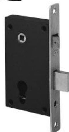
Tête à larder