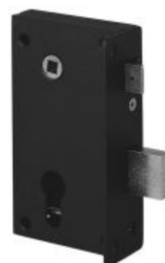
Tête en applique